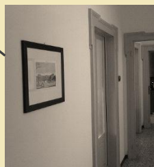
Sede di Monza - uffici