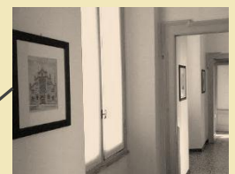
Sede di Monza - uffici